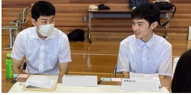
卒業生も参加し、趣味や規則正しい生活が大事だと教えてくれました。