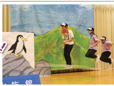
ペンギンショー 大縄跳びに挑戦！