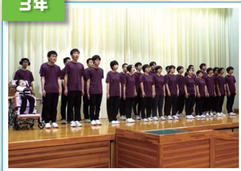
みんなで作詞した歌 「We are best friends ～最高の友達～」