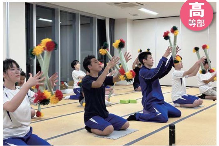
本荘北中学校3年生との交流～生活単元学習(3年生)～