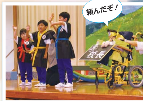
巻き物を探しにいつてきま～す！