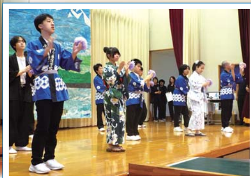
最後は菖蒲音頭で盛り上がりました！