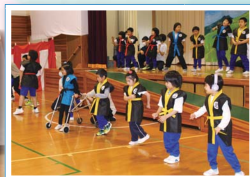
にんにん！みんなで忍者トレーニング