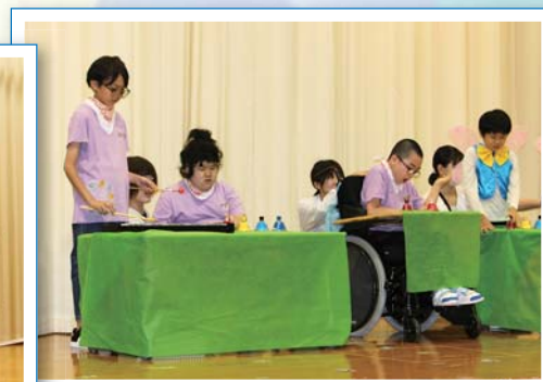
「星に願いを」心をひとつに演奏しました