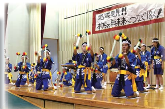
民族芸能「天神あやとり」