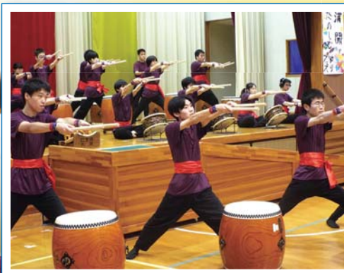
3部構成の太鼓演奏に挑戦！