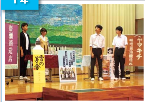
由利本荘市自慢の老舗や食をストーリー仕立てで紹介！