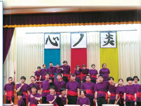
タイトルは「27人の太鼓 ～心の炎～」みんなの心が一つになり、最高の演奏になりました