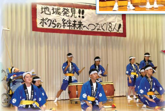
太鼓と歌で盛り上げました！