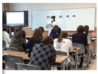
『給食ができるまで』の動画を視聴

11月14日(金)に給食試食会を行いました。この試食会は、子どもたちが普段食べている給食を実際に体験していただき、本校の食育の取組や学校給食への理解を深めるための会です。感染症対策もあり6年ぶりの開催となりましたが、たくさんの保護者の方に参加いただきました。