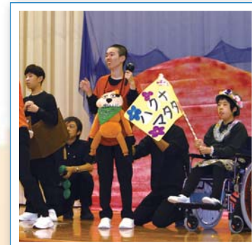
ハクナマタタ「心配ないさー」