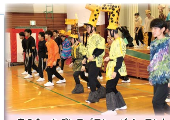
息の合ったダンス「ワン・バイ・ワン」