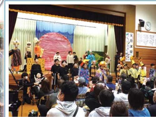
心を込めて歌った 「サークル オブ ライフ」