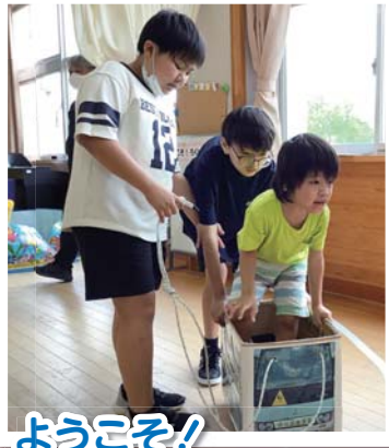
ようこそ！ ろくいちすまいるらんどへ ～6年生が1年生をご招待～