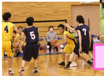
「能代ウィンターカップ」12/19 女子3位入賞