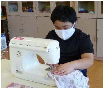
中学部～手芸班の製品作り