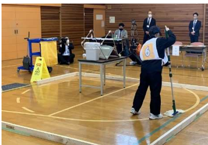
職業教育フェア・技能競技大会 ～ビルクリーニング部門