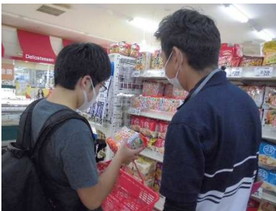
寄宿舎～サークル活動